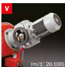
Motovariatore Blade speed variator