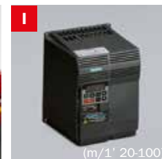
Inverter Frequency converter