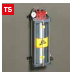
Dispositivo taglio a secco Dry cooling device