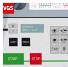
Visualizzatore gradi angolo di taglio Cutting angle display