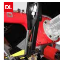
Dispositivo controllo deviazione lama Blade deflection control device