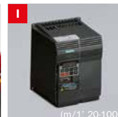
Inverter Frequency converter