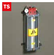
Dispositivo taglio a secco Dry cooling device