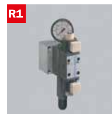
Reg. pressione morse Adjustable vice pressure