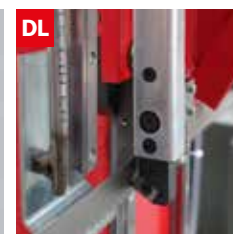
Dispositivo controllo deviazione lama Blade deflection control device