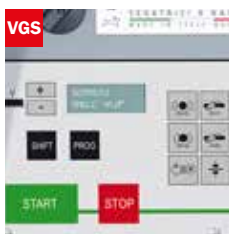
Visualizzatore gradi angolo di taglio Cutting angle display