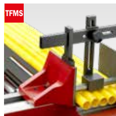
Taglio fascio meccanico Mechanical bundle clamping device