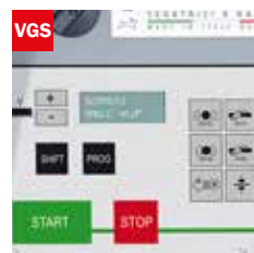
Visualizzatore gradi angolo di taglio Cutting angle display