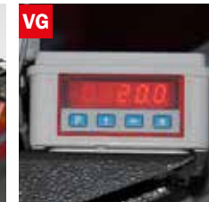
Visualizzatore gradi angolo di taglio Cutting angle display