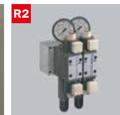
Reg. pressione morse doppio Adjustable vice pressure