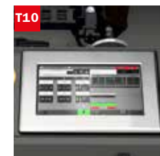
Touch screen 10" (solo per versione TOUCH) 10" touch screen (only for TOUCH mod.)