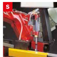
Skip elettrico Electrical skip