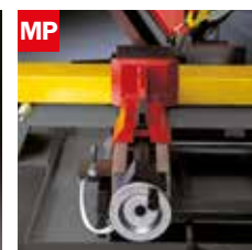
Morsa pneumatica Pneumatic vice