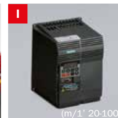
Inverter Frequency converter