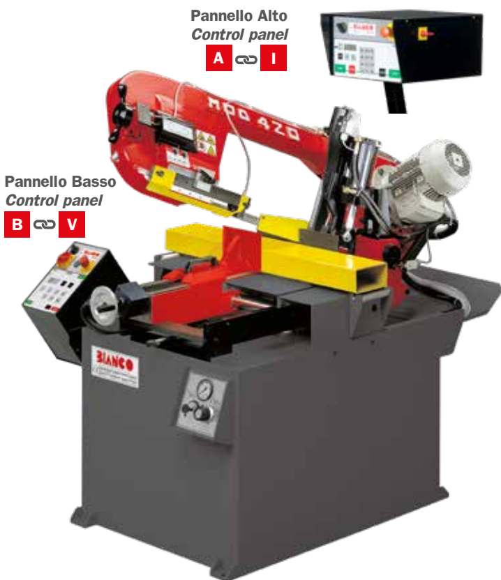
Pannello Alto Control panel