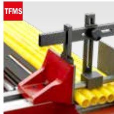
Taglio fascio meccanico Mechanical bundle clamping device