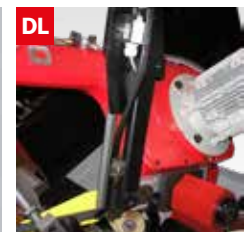
Dispositivo controllo deviazione lama Blade deflection control device