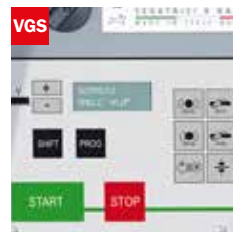
Visualizzatore gradi angolo di taglio Cutting angle display