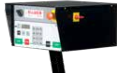
Pannello Basso Control panel