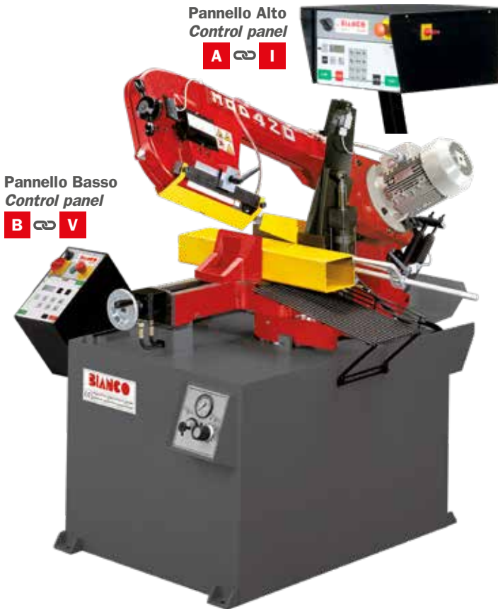
Pannello Alto Control panel