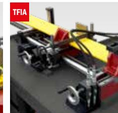
Taglio fascio oleodinamico Hydraulic bundle clamping device