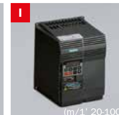
Inverter Frequency converter