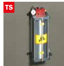
Dispositivo taglio a secco Dry cooling device