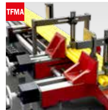
Taglio fascio meccanico Mechanical bundle clamping device