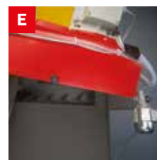
Evacuatore trucioli Chip conveyor