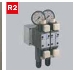
Reg. pressione morse doppio Adjustable vice pressure