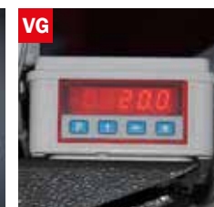
Visualizzatore gradi angolo di taglio Cutting angle display